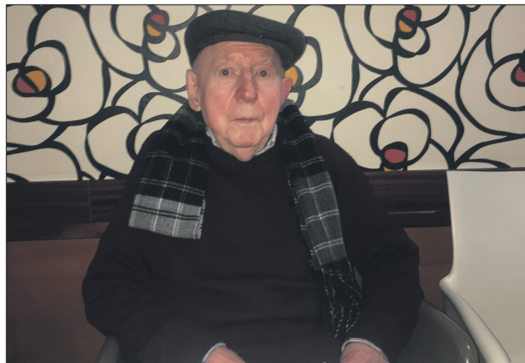
'Sevilla', en el Express

Vistalegre, donde se habían trasladado meses antes, un nuevo sobresalto bélico hace que su madre, con fundados temores motivados por el acoso de las tropas rebeldes a la República que bombardeaban Grao constantemente, se traslade con sus vástagos a Aces. Allí permanecieron hasta que las columnas gallegas tomaron Grao. Recuerda esta estancia con nostalgia, a pesar de su corta edad. "No pasamos necesidades pues había de todo, menos pan blanco y azúcar, pero había "borroña", huevos, verduras, patatas, carne y mucha leche aunque no me gustaba". Los avatares de su longeva vida comienzan cuando, en su estancia en el pueblo de nuestro concejo vecino, fallece repentinamente un hermano de un año de edad. El dueño de la casa donde vivían le hizo un pequeño ataúd de madera y al amanecer lo fue a enterrar al cementerio. "Sevilla", con